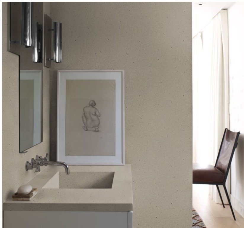
▼ BAÑO: CORIAN® KEYSTONE PARA ENCIMERAS DE BAÑO, LAVABOS Y REVESTIMIENTOS DE PARED.

Corian® Solid Surface with Resilience Technology™ es una solución de prestaciones superiores para una gran variedad de entornos comerciales, como el sector hotelero, el educativo, la sanidad, el sector minorista, el de oficinas y la restauración, además del mercado residencial. Las imágenes muestran algunas de sus posibles aplicaciones.